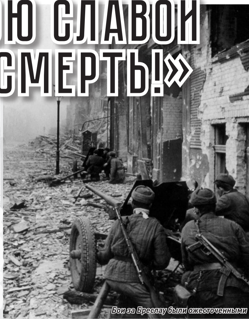
Бои за Бреслау были ожесточенными

В памятные дни, и в первую очередь 9 Мая и 22 июня, зеленогорцы возлагают цветы к стеле Победы, где на мемориальных досках увековечены имена 302-х участников Великой Отечественной войны. Что мы знаем о них – земляках, похороненных в братских могилах или на далеких кладбищах прифронтовых населенных пунктов? Кто они, жители Орловки, Ильинки, Успенки, Слюдрудника, Высотино, Усть-Барги и Богуная, заслужившие благодарную память потомков? Продолжаем рассказывать о тех, чьи имена занесены на гранит мемориального комплекса на городской набережной.