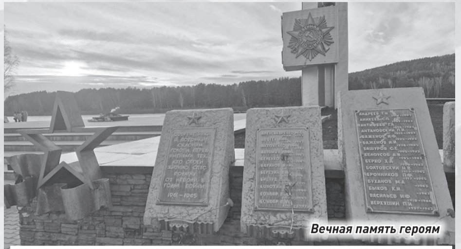
Вечная память героям